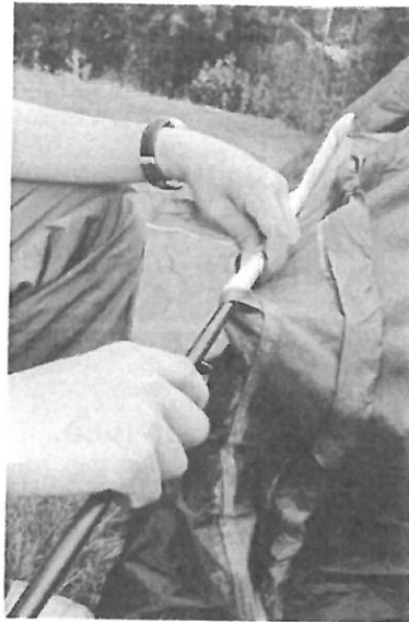
Een tent moet stevige verbindingen hebben.

Een tent is een constructie . Hij is opgebouwd uit verschillende onderdelen . Tentdoek en tentstokken zijn vaak gemaakt van kunststof . De ene tent heeft de vorm van een driehoek . De andere tent heeft de vorm van een boog . Driehoeken en bogen zijn stevige vormen.