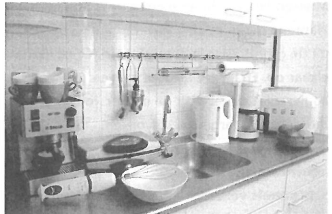
In huis vind je veel elektrische apparaten.

Stroom gaat door metalen draden. Metaal is een goede geleider . Daaromheen zit plastic. Plastic is een slechte geleider. Bij kortsluiting is het plastic om de electriciteitsdraden kapot gegaan en komt het metaal tegen elkaar aan.