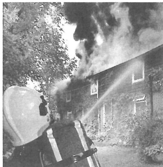
Kortsluiting is gevaarlijk. Er kan brand door ontstaan.