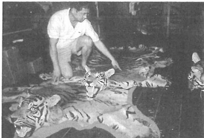
Mensen zorgen er ook voor dat dieren uitsterven.

Planten gebruiken koolzuurgas bij de fotosynthese . Door fossiele brandstoffen te verbranden, zorgt de mens voor te veel koolzuurgas. Te veel koolzuurgas in de dampkring zorgt voor het broeikas effect . Daardoor wordt het warmer en kan de zeespiegel stijgen . Dat zorgt voor overstromingen. Door groene energie te gebruiken, kunnen we de klimaatverandering stoppen.