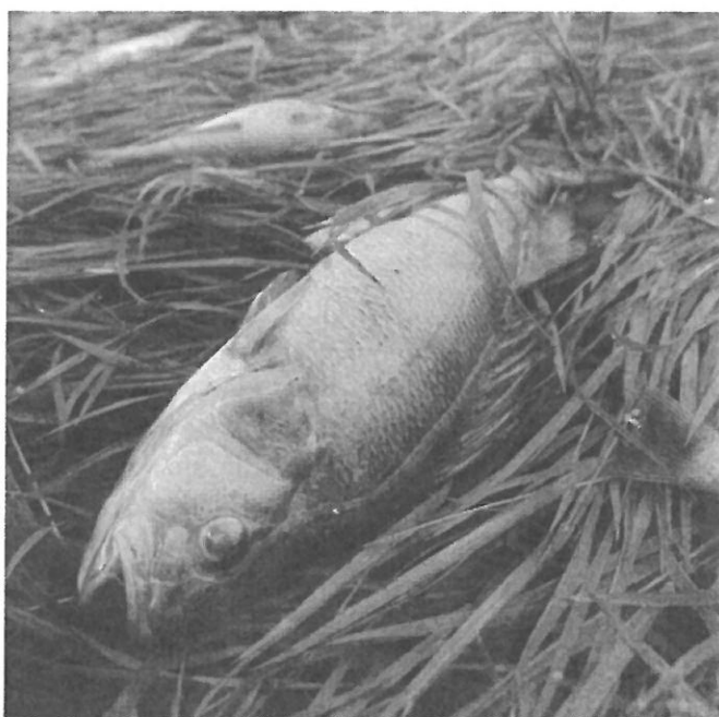
Als de vissen dood zijn, heeft de otter niets te eten.