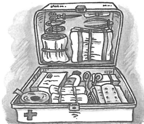
In een EHBO-doos zit alles wat je nodig hebt bij kleine ongelukjes.